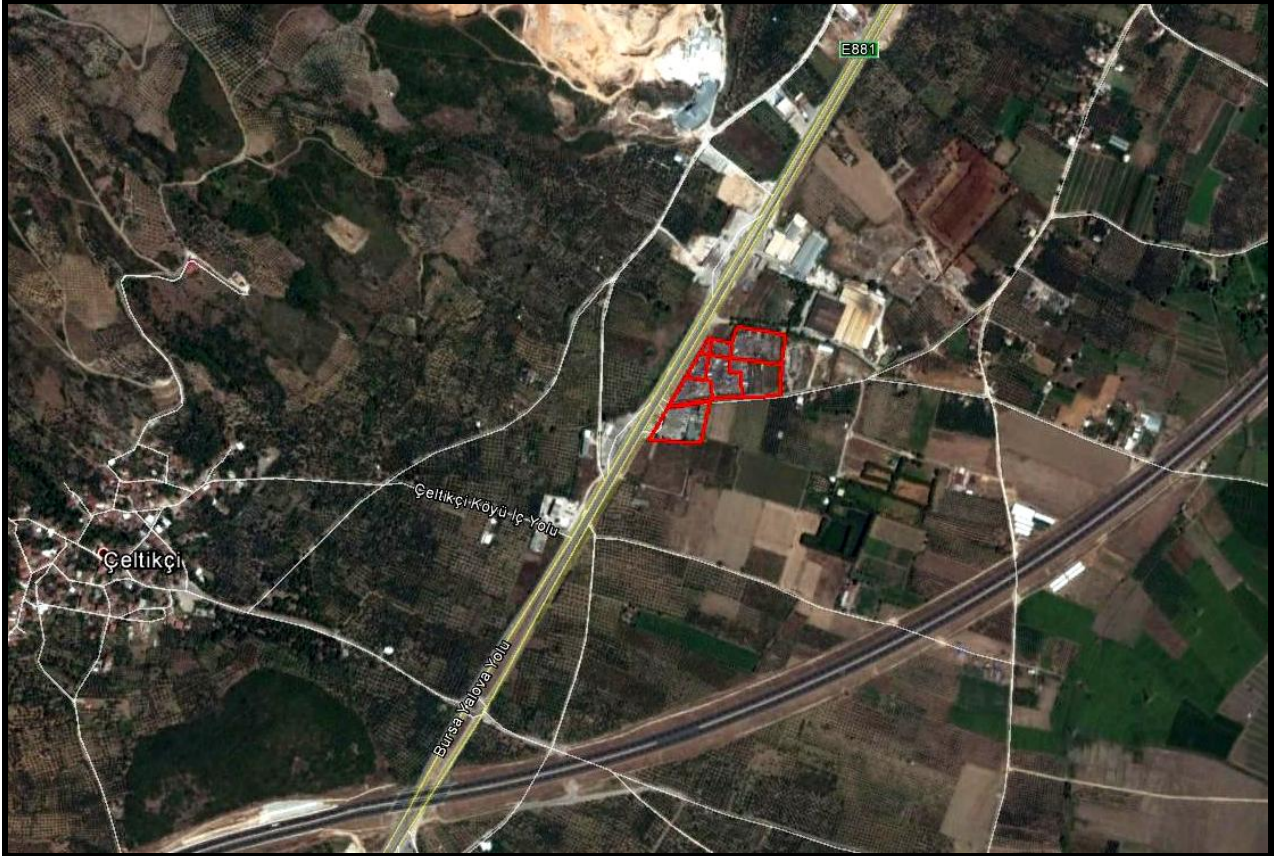
Şekil 1: Planlama Alanının Konumu ve Yakın Çevresi

Bursa İli, Orhangazi İlçesi, Çeltikçi Mahallesi, 51-52-53-54-55-56-60 ve 212 Nolu Parseller Orhangazi-Bursa Karayoluna cepheli olup, Orhangazi'ye gidiş istikametinde yer almaktadır.